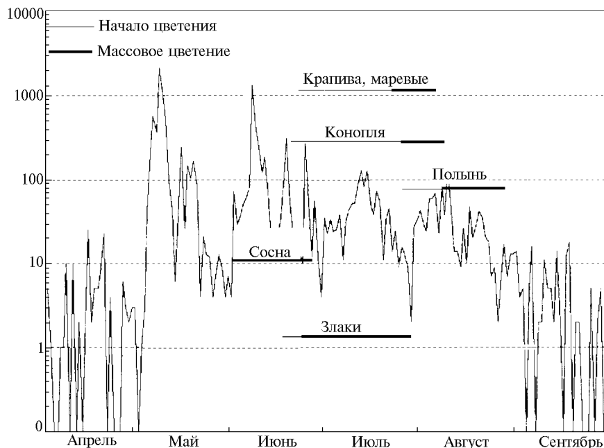
Рис. 1. Динамика сезонного изменения концентрации пыли по данным осадка на липких горизонтальных стеклах, пыльцевых зерен/см 2

Суточная динамика концентрации пыли в воздухе обусловлена как временем цветения растений, так и погодными условиями. У сосны обыкновенной максимум пыли летит в дневные часы, ранним утром вылет слабый, а ночью он почти прекращается в связи с понижением температуры и повышением влажности воздуха [12]. Это обуславливает резкое возрастание концентрации ПЗ сосны в утренние часы, высокое их содержание в воздухе в течение дня и постепенное снижение вечером и ночью. На рис. 2 приведен типичный пример изменения счетной концентрации пыли сосны. Как видно из этого рисунка, разница между содержанием пыли в воздухе в дневное и ночное время достигает двух порядков.